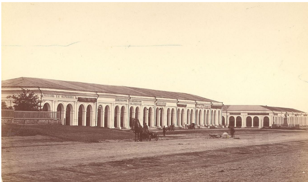
Рис. 2. – Фотография здания гостинного двора в Новочеркасске (1870–1889 гг.) [24].

сооружения. Во второй половине XVIII происходит расширение типологического ряда торговых зданий, на площадях начинают возводиться торговые и гостиные ряды. До начала XIX в. они возводились из дерева (Гостиные ряды на Базарной площади в Ростове по проекту Т. Шаржинского, 1820-е гг.), затем постепенно происходит их замена каменными строениями [5]. Так в Ростове на северо-восточном углу площади Базарной возводятся два каменных здания лавок гостинного ряда (1840-е гг.). В Таганроге в 1840-х гг. возводятся Александровские торговые ряды (арх. М.А. Кампиньони), а в Новочеркасске на Платовской площади в 1854 г. были построены по проекту И.О. Вальпреде два корпуса гостинного двора (рис.2).