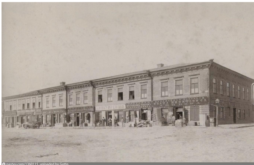
Рис. 3. – Фотография каменных торговых рядов на Базарной площади Нахичевани-на-Дону (1893–1896 гг.) [25].

Расположение культовой доминанты в композиции площади обусловлено различными факторами. Стоит отметить, что для исследуемых городов не характерно размещение культового сооружения в центре площади с дальнейшим формированием вокруг него торгова. Большинство церквей и храмов расположены со смещением относительно центра пространства площади (рис.1). Такое расположение позволило сформировать несколько функциональных зон, отделить торговлю от культовой функции.