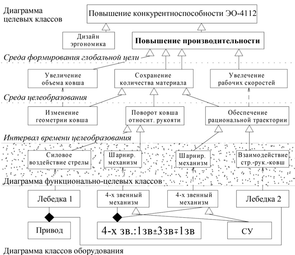
Рис. 1. – Объектно-целевая диаграмма классов системы СУРО

механизм (4-х зв.:1 зв. ± 3 зв. ∓ 1 зв.) и Систему управления (СУ). Определенные в результате анализа классы оборудования позволяют реализовать все технологические операции, необходимые для достижения выявленных на нижнем уровне ДЦК подцелей и, таким образом, являются элементами синтеза базового инварианта структуры СУРО.